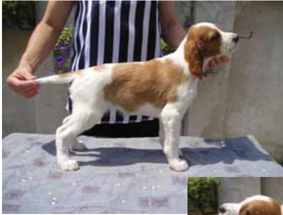
Meagan mit 9 Wochen