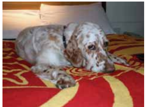
Im Bett ist es am Bequemsten...