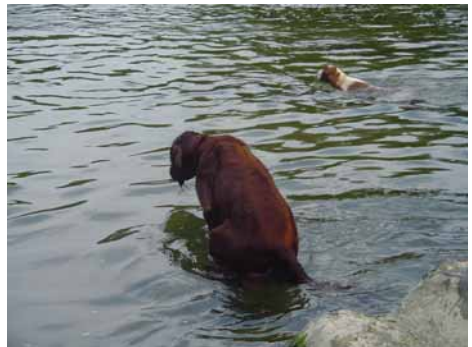
Bohême und Meagan