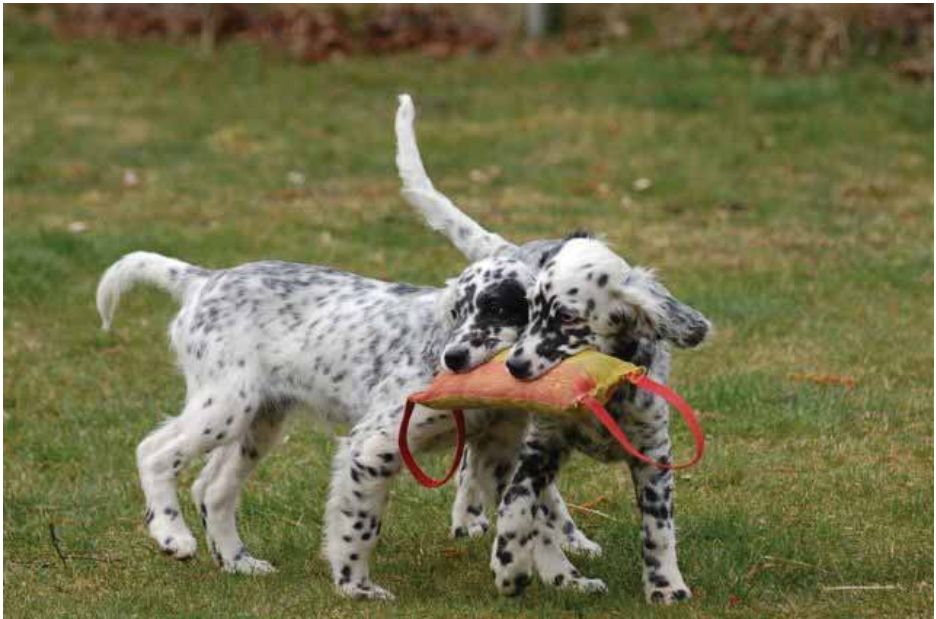
Audrey und Kite

Apportierkurs! Da machen wir doch gleich mit!