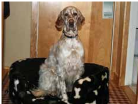
Endlich im Hotel...