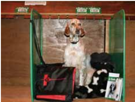
Die Schweiz an der Crufts...

Nun ging es los, die Fahrt begann mit starkem Schneefall in der Schweiz und wurde immer sonniger und wärmer Richtung England.