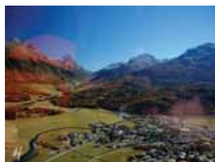
Celerina aus dem Heli