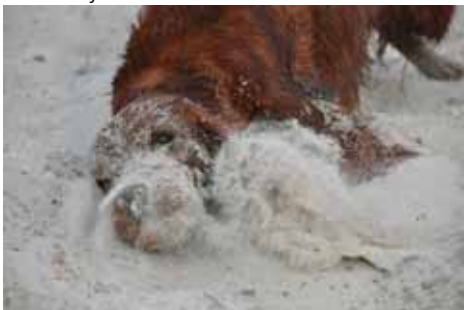
Houston showt vor Eilyn