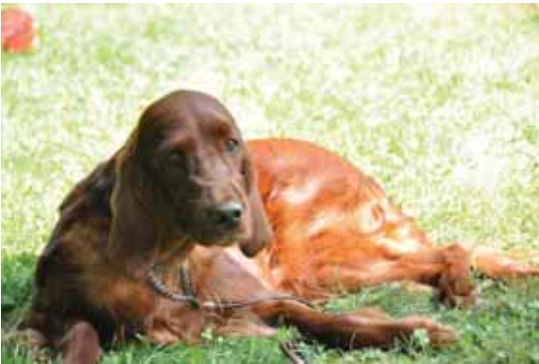
Eilyn geduldig am Warten