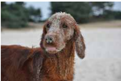
Eilyn im Sand...