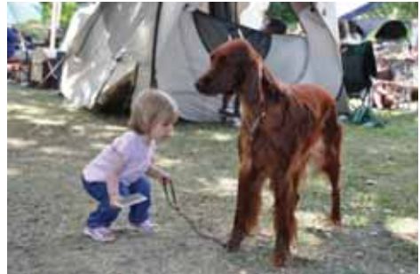
Ist Eilyn genug gekämmt?