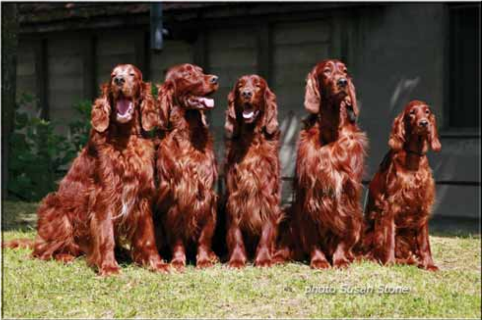
Coppersheen Blaze (11 Jahre), Coppersheen Daredevil (3 Jahre), Coppersheen Coalville Lad (5 Jahre), Coppersheen Dark Gold Duke (3 Jahre) und Anlory Red Sky (1 Jahr)