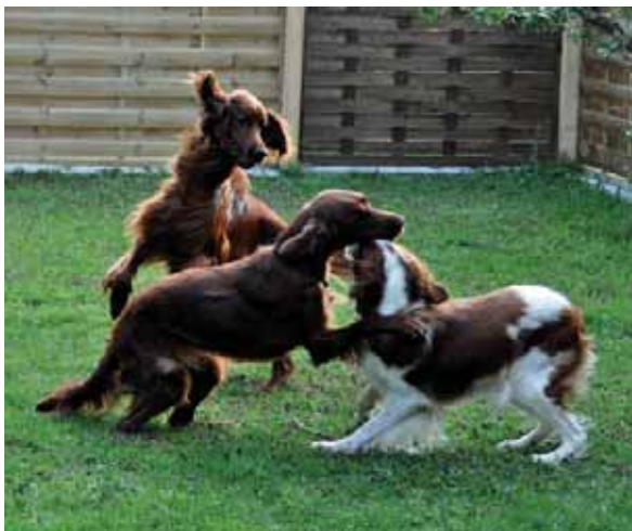
Die Feriehunde Nelson und Aine bringen Leben in die Bude...