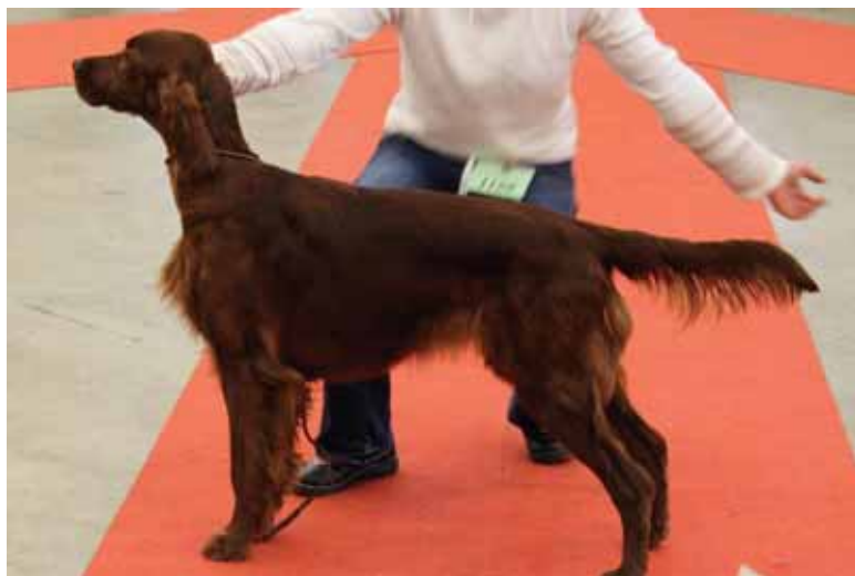
Golden Wish de la Raverette. Champion Suisse de Beauté Jeune