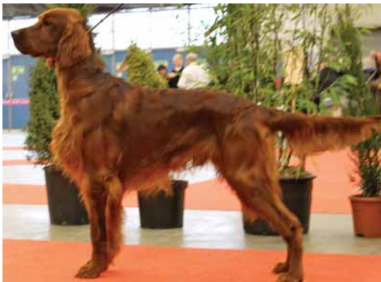
Fantastic Falcon de la Raverette, Champion Suisse de Beauté