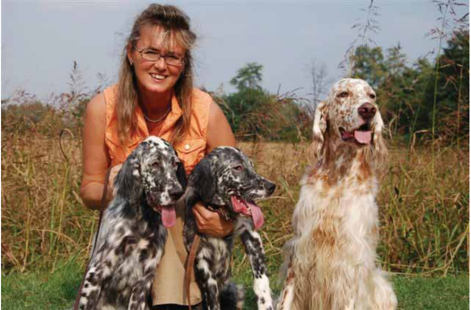
Kiss und Vegas, die übrig Gebliebenen mit Papa

Platz gefunden zu haben. Übrigens ist aus dem Stinkstiefel von damals ein wunderschöner und über alle Massen liebenswürdiger und unkomplizierter Rüde geworden (ich hoffe, es stimmt noch immer...), der sein Zuhause mit zwei Katzen teilt und mit zur Arbeit darf.