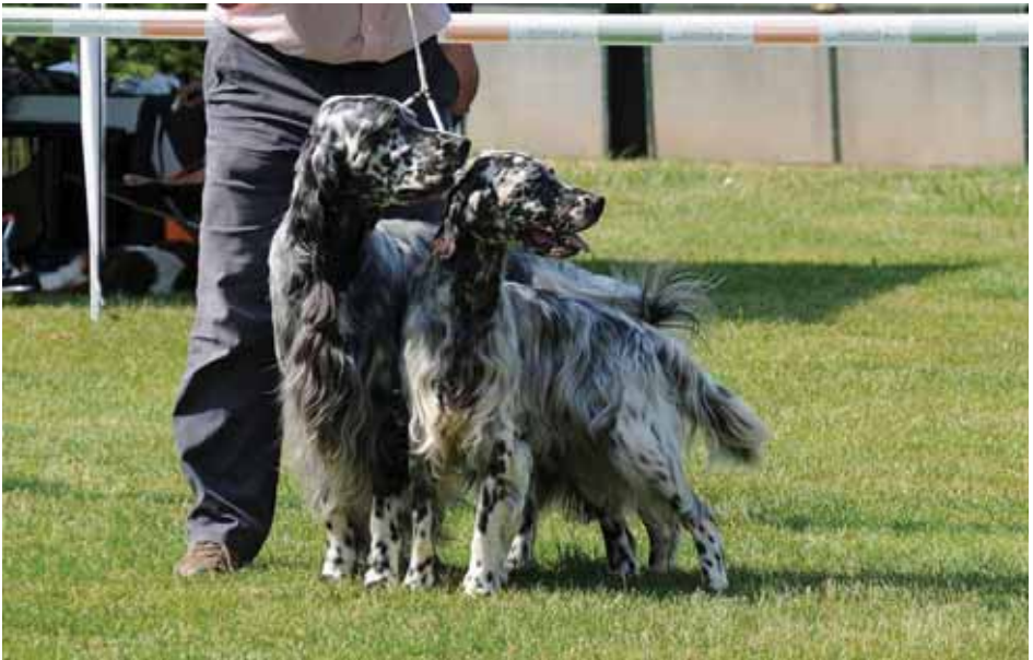
Fairray Kissproof und Gladiator

Ich bereue es nicht, ihn weggegeben zu haben, er führt jetzt das Leben, das ich mir für ihn wünsche. Die Dame des Hauses war zwar kurz vor dem Ausziehen, da sie etwas genervt von der Jammerei und Weinerei von Vegas war, aber ich konnte sie beruhigen, das legt sich in den ersten Jahren.