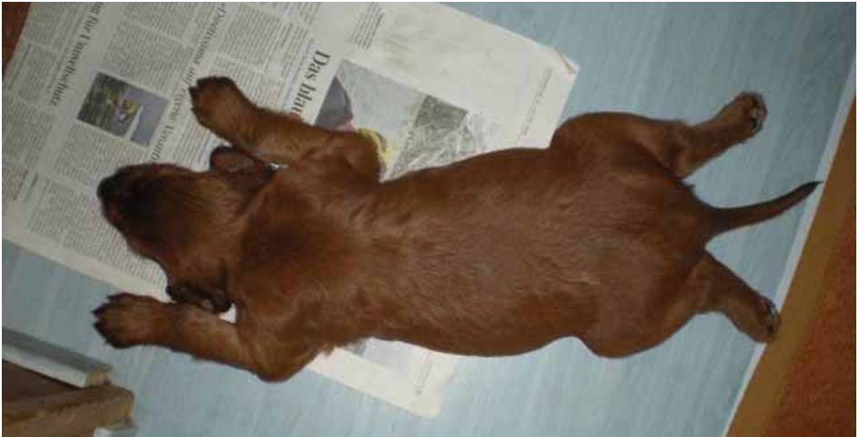
Perfektes "Red Gold of Saint George-Down" mit viereinhalb Wochen...