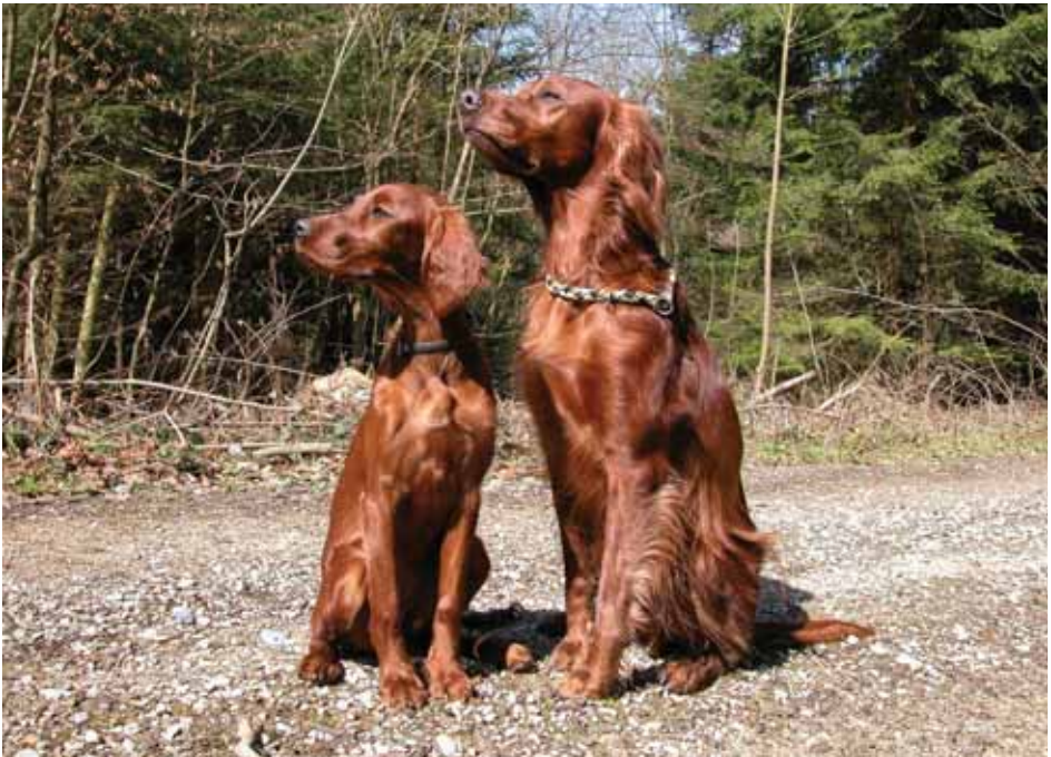
Eilyn-Ciara vom Gebirgsjägerhof und Bajazzo Champion of Tiffany