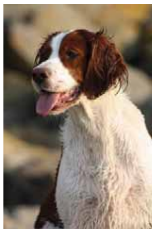
Meagan: 4,5 Jahre