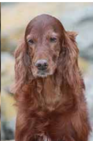
Havanna: 10 Jahre