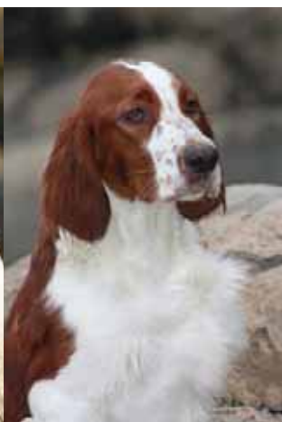
Anaïs: 18 Monate