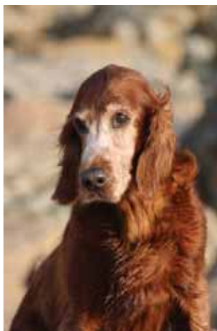
Bohême: 13 Jahre

Unser Tag fing mit einem wunderbaren Spaziergang an der Plage de Kersiguenou an, welche nur 300m vom Haus entfernt liegt. Ein wahres Paradies für lange Spaziergänge in traumhafter Natur. Unsere Mädels und unser Bub waren bereit!