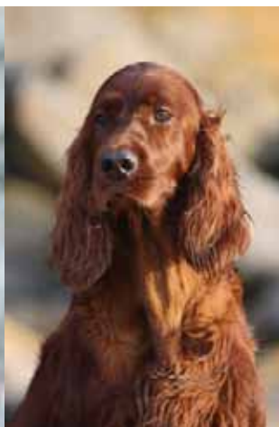
Sue: 5,5 Jahre