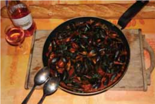
Menschenmenu; Cozze an Tomatensauce