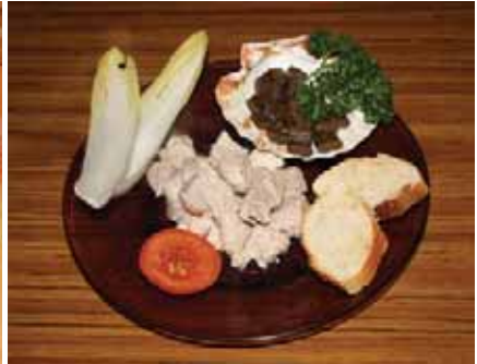
Hundemenu; Fitnesssteller mit Salat

Langsam machten wir uns wirklich Sorgen, ob wir bei der Heimfahrt auch wirklich noch alle im Auto Platz finden würden ☺.