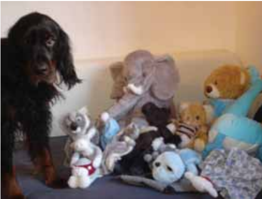
Memory beim Anpeilen von den Stofftieren

Schon zu Beginn meiner Schwangerschaft mussten sich unsere drei Hundedamen an aussergewöhnliche Tagesabläufe gewöhnen. Je nach meiner Verfassung gestalteten sich auch unsere Spaziergänge und Arbeitsaktivitäten. In dieser Zeit mussten sie lernen, dass es Tage gibt, wo sie so gut wie keine Aufmerksamkeit bekommen. Dafür fanden sie es ganz toll, dass sich in einem Zimmer plötzlich Stofftiere ansammelten, und da bedienten sie sich schon das ein oder andere Mal, besonders Broadway hat es auf Musikdosen abgesehen.