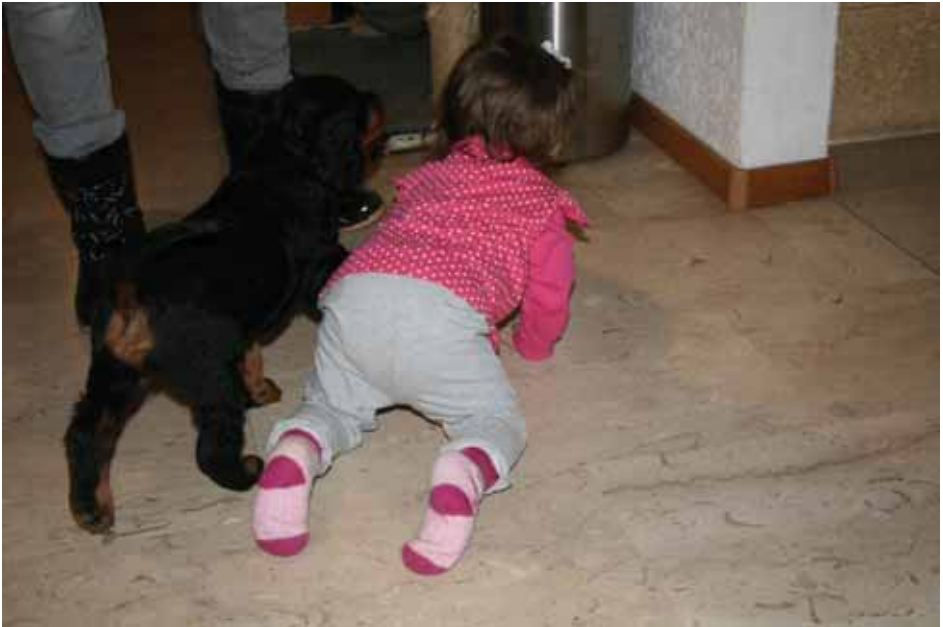
Welpen mit 9 Wochen und Kleinkind von 10 Monaten

Als Züchter schauen wir sehr auf positive Welpen und Kinder Prägung.